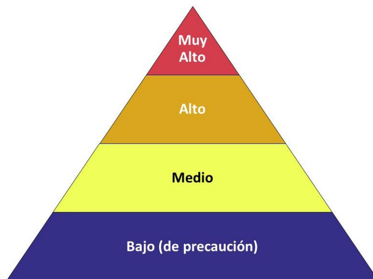
Figura G.1 - Pirámide de riesgos ocupacional para el COVID-19

La pirámide de riesgo ocupacional muestra los cuatro niveles de exposición al riesgo en la forma de una pirámide para representar la distribución probable del riesgo.